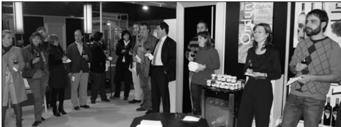
Standera udal ordezkariak, Bizkaiko Ahalduen Nagusia eta Nekazaritza Diputatua hurbildu ziren. Al stand acudieron los representantes municipales, el Diputado General de Bizkaia y la Diputada de Agricultura.

Abenduaren 16tik 19ra "Agosto, saber y sabor 2011" ekitaldia izan zen BECen, Slow Food mugimenduaren filosofia zabaltzea helburu zuela. Torinoko Salone del Gusto izenekoan oinarrituta, Agosto jende guztiari irekita dago, eta artzau-gastronomia eta elikadura sektorearen erreferentzia bilakatu da.