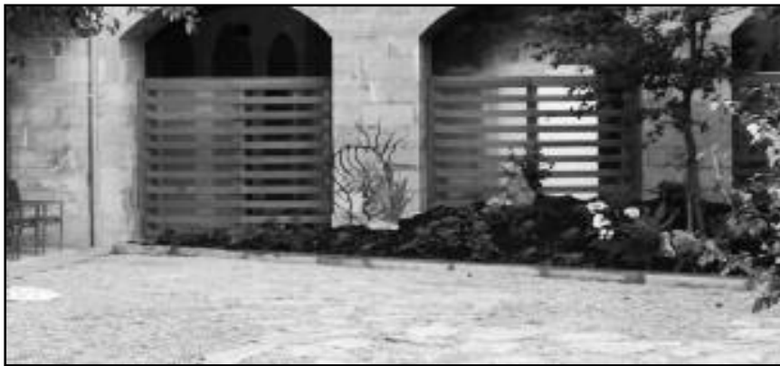
Foto del estado actual del patio con un nuevo jardín y zona de terraza.