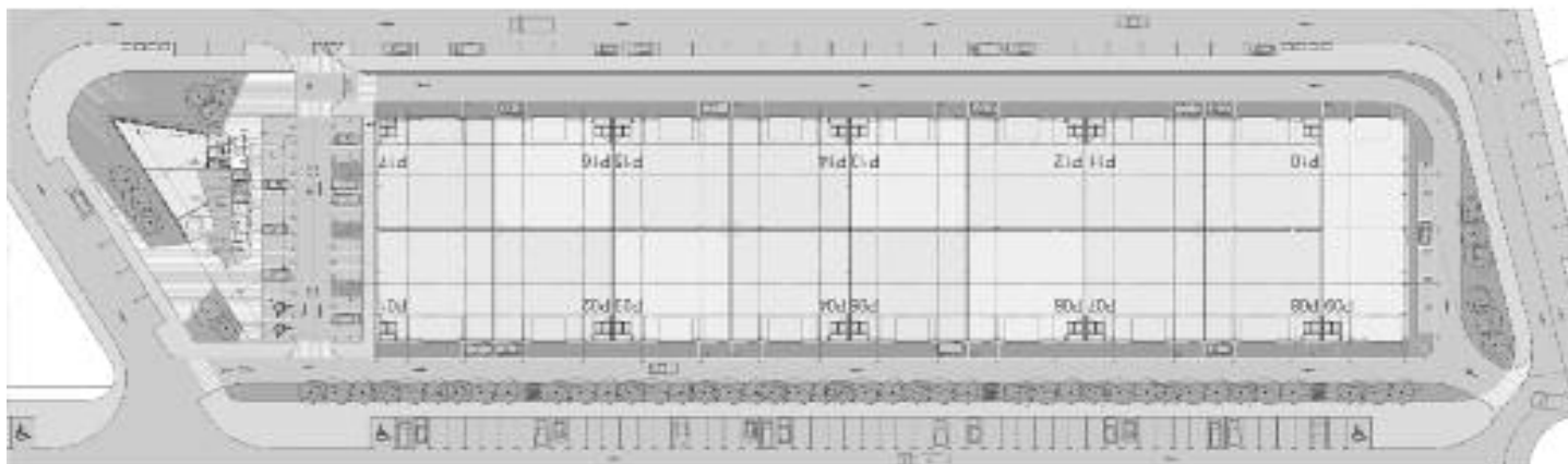
Plano de distribución de módulos y espacio del futuro Elkartegi de Orduña